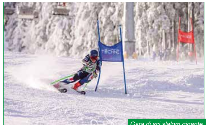
Gara di sci slalom gigante.