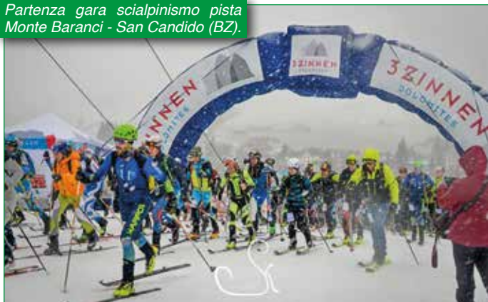
Partenza gara scialpinismo pista Monte Baranci - San Candido (BZ).

partecipato alla gara 344 Alpini e 67 aggregati in rappresentanza di 42 Sezioni e 11 militari hanno affrontato le difficoltà del percorso di 10 chilometri per le categorie di atleti con meno di 60 anni e di 5 chilometri per gli atleti con più di 60 anni.