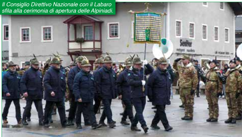
Il Consiglio Direttivo Nazionale con il Labaro sfilava alla cerimonia di apertura delle Alpiniadi.

Alpine "Volpe Bianca 2024" a Corvara e San Candido cui hanno fatto seguito poi con le gare della Federazione Italiana Sport Invernali Paralimpici del 21 e 22 febbraio sulla pista Monte Baranci di San Candido.