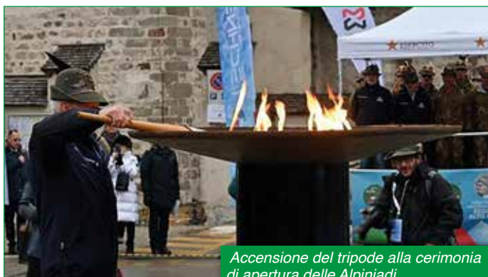
Accensione del tripode alla cerimonia di apertura delle Alpiniadi.

"Oltre a costituire una grande manifestazione sportiva", ha concluso il Sottosegretario Rauti, "le Alpiniadi rappresentano la sintesi preziosa tra sport, inclusione e addestramento militare, con un comune denominatore: la persona al centro e lo spirito di squadra, il Noi prima dell'io. Quello spirito di fratellanza che caratterizza da sempre il Corpo degli Alpini, la più antica fanteria da montagna del mondo, protagonista indiscusso della storia italiana, simbolo di eroismo e di valore ieri come oggi".