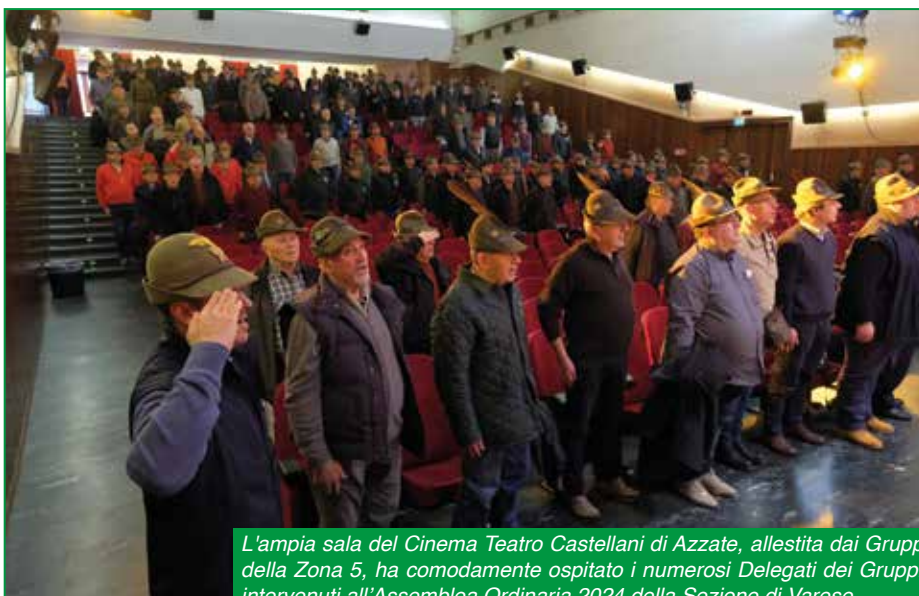
L'ampia sala del Cinema Teatro Castellani di Azzate, allestita dai Gruppi della Zona 5, ha comodamente ospitato i numerosi Delegati dei Gruppi, intervenuti all'Assemblea Ordinaria 2024 della Sezione di Varese.

Gli Alpini di Azzate avevano organizzato anche un ottimo rinfresco in locali attigui al teatro, molto gradito da tutti.