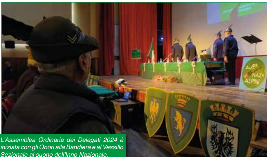
L'Assemblea Ordinaria dei Delegati 2024 è iniziata con gli Onori alla Bandiera e al Vessillo Sezionale al suono dell'Inno Nazionale.

L'Assemblea Ordinaria dei delegati della Sezione A.N.A. di Varese è regolarmente convocata presso il Cinema-Teatro Castellani in Azzate.