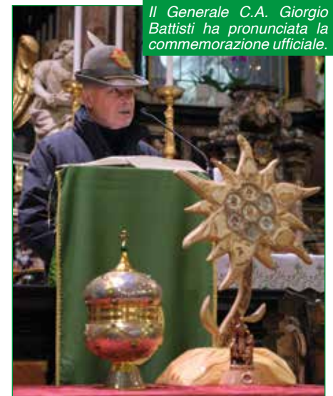
Il Generale C.A. Giorgio Battisti ha pronunciata la commemorazione ufficiale.