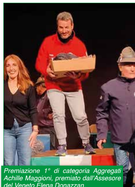
Premiazione 1° di categoria Aggregati Achille Maggioni, premiato dall'Assessore del Veneto Elena Donazzan.