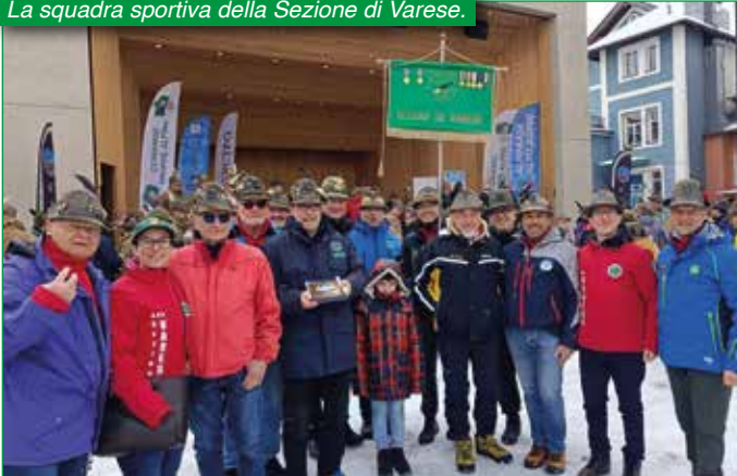
La squadra sportiva della Sezione di Varese.