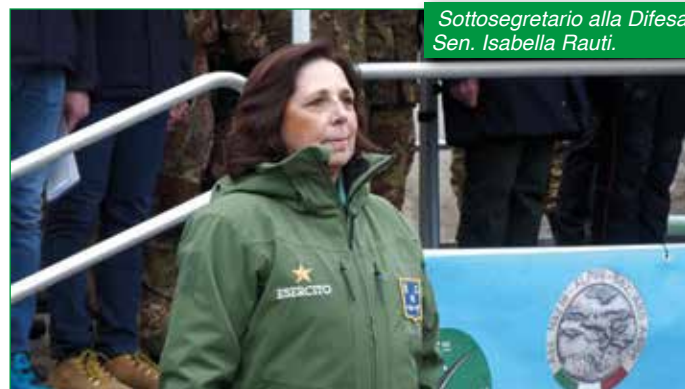
Sottosegretario alla Difesa Sen. Isabella Rauti.