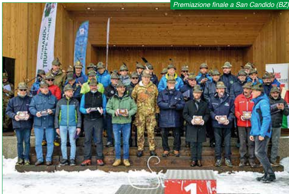
Premiazione finale a San Candido (BZ).